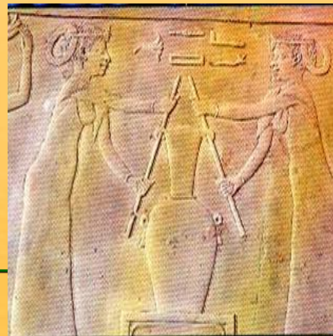
Egipatski reljef, IV st. pr. n. e.